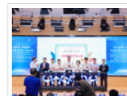
“科创中国”大湾区青年百人会论坛暨...