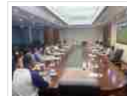
省科协调研宣传部到清远开展调研