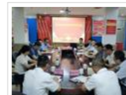
省科协调研宣传部到韶关开展调研