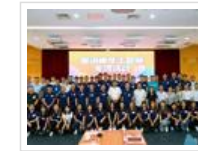
省科协与香港工程师学会联合举办粤港...