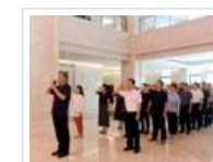
省科协组织党员干部参观省反腐倡廉教...