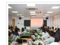
省科协举办“芳心向党 温暖同行”插...