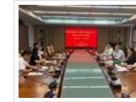
新加坡工程师学会到访广东省科协