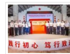
“陈心陶精神教 育基地”揭牌暨 “心陶...”