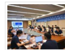
2022中韩传染病 防控学术研讨会 在穗召开