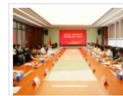
省科协赴国家海外人才离岸创新创业基...