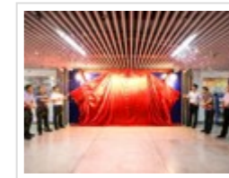
东莞市科协事业发展中心挂牌成立