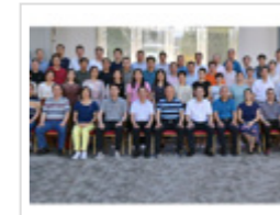
广东省科技社团党组织负责人培训班 ...