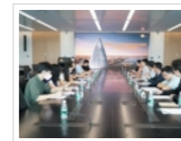
省科协赴深圳开展深